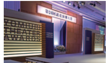
第24回読売演劇大賞