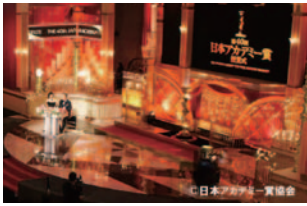
第40回日本アカデミー賞授賞式