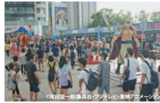
お台場 みんなの夢大陸2017