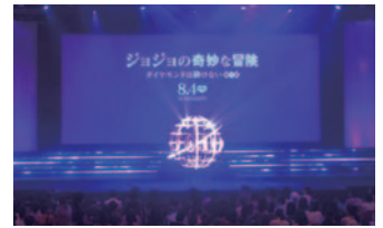
「ジョジョの奇妙な冒険」 ジャパンプレミア