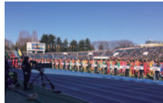
第96回 全国高校サッカー選手権大会 開会式