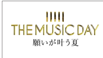
THE MUSIC DAY 願いが叶う夏。 会場運営